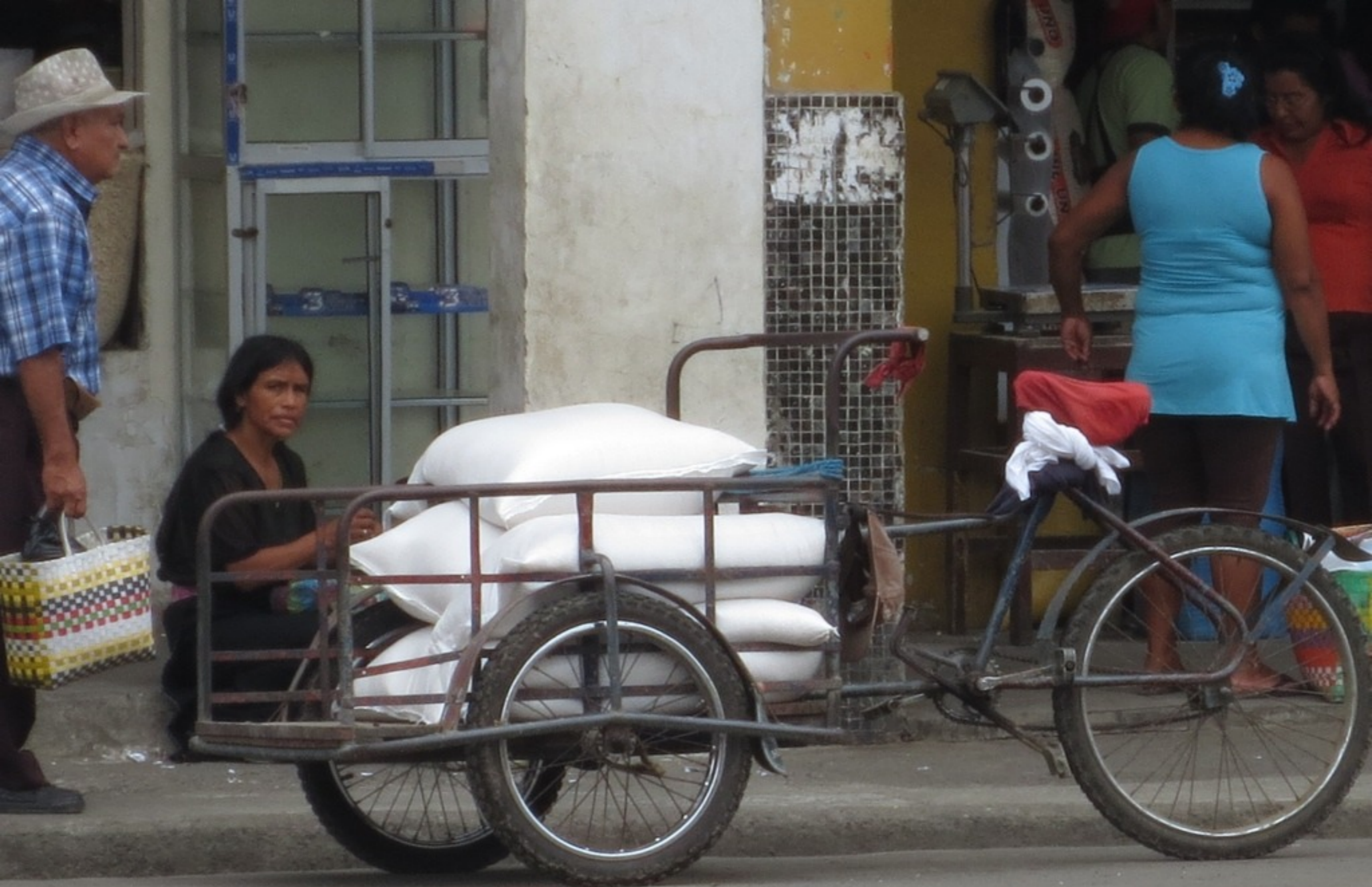
U-Haul - Ecuador Style